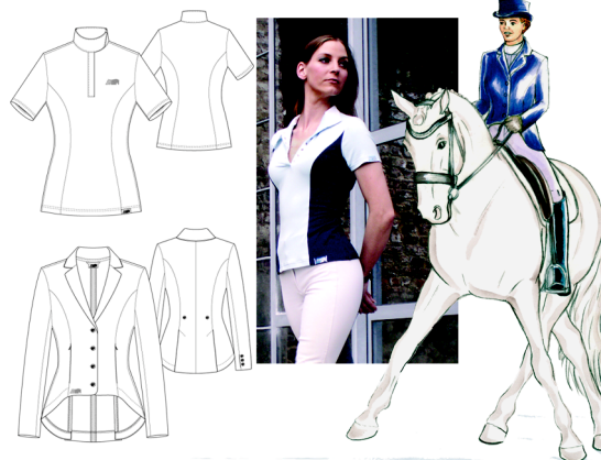
Abb. 3: Turniershirt „Leona“ und Sakko „Soft-Seoul“: Fotografie, technische Zeichnungen, Modezeichnung

Als Prototypen wurden aus der „Goldreiter“ Kollektion das Turniershirt „Leona“ und aus der Trendkollektion „Orchidance“ das Sakko „Soft-Seoul“ umgesetzt.